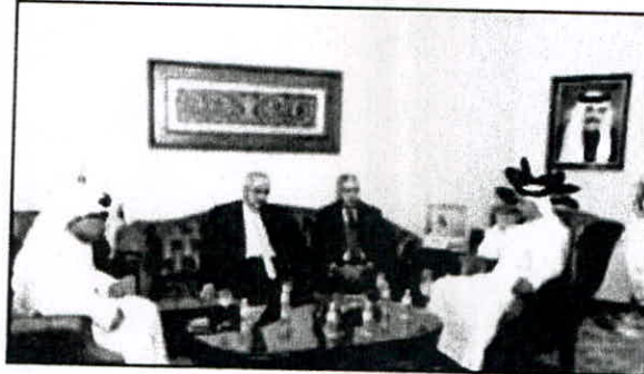
الأثري مستقبلاً مدير جامعة أريزونا

الأبحاث، وتبادل و تعليم الموظفين الأكاديميين من خلال التفرغ العلمي بحلقات دراسية و دورات و ورش عمل- و التطوير المشترك لبرامج و مشاريع الأبحاث، وكذلك للدراسات الجامعية و الدراسات العليا.