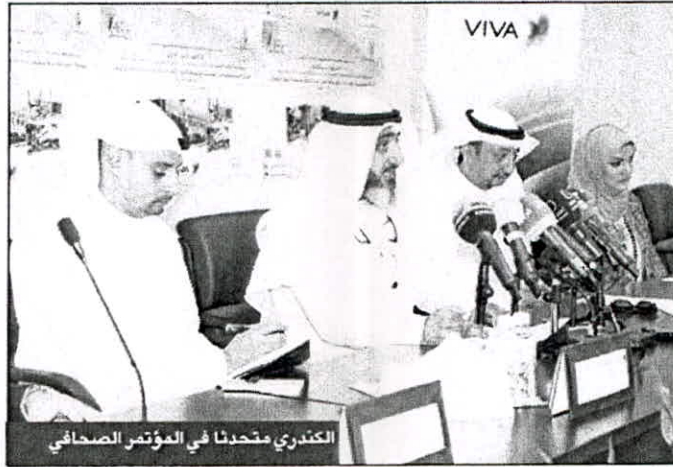
الكتدري متحدثاً في المؤتمر الصحفي

الكتدري: ملتقى «الاتصالات» يؤكد اهتمامنا بتوفير احتياجات الخطة الإنمائية