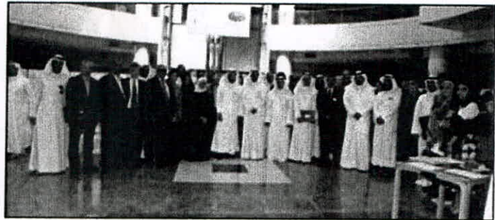
لشاركون في مسيرة جامعية مع مجلة الهيئة

الأثري: ضرورة إبراز الأبحاث التي يمكن تطبيقها على الواقع